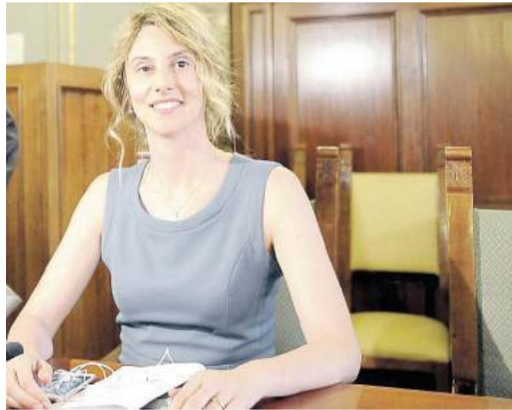
Il ministro Marianna Madia

Anche per il governo potrebbe essere una via d'uscita, evitando che la trattativa sugli statali possa interrompersi bruscamente alla vigilia del referendum sulle riforme costituzionali. Ma ci sono comunque dei passaggi delicati da affrontare. Innanzitutto nella manovra andrebbe inserita una misura che congeli la legge Brunetta. Il governo sarebbe disponibile, ma solo avendo già un accordo con i sindacati che stabilisca un nuovo sistema di valutazione che abbia dei meccanismi vincolanti da introdurre nel nuovo Testo unico sul pubblico impiego. Il secondo punto riguarda la platea di chi dovrebbe ricevere questo aumento «ponte». Il ministro Madia ha sem-