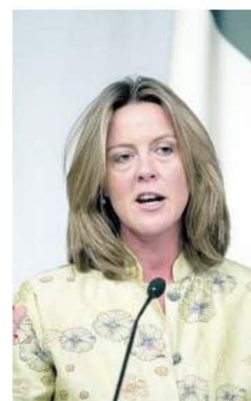
Il ministro della Sanità Beatrice Lorenzin

CON LE GARE CONSP COSTI TAGLIATI DEL 20% SULLE SIRINGHE PIANO PER CAMBIARE CIRCA 16 MILA TAC E RISONANZE